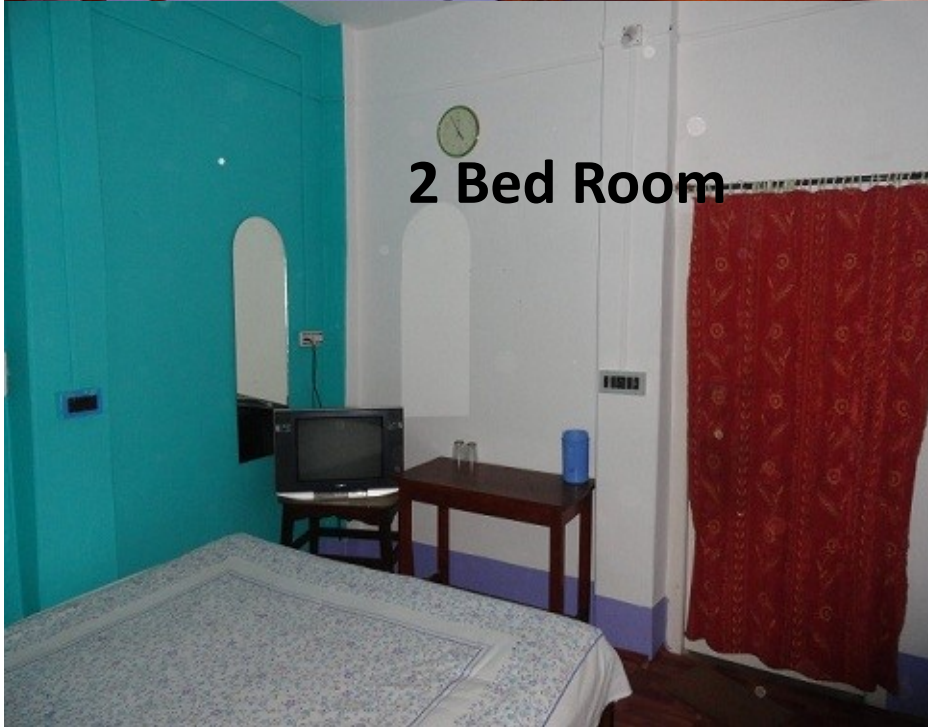
2 Bed Room