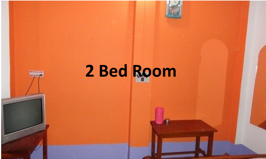
2 Bed Room