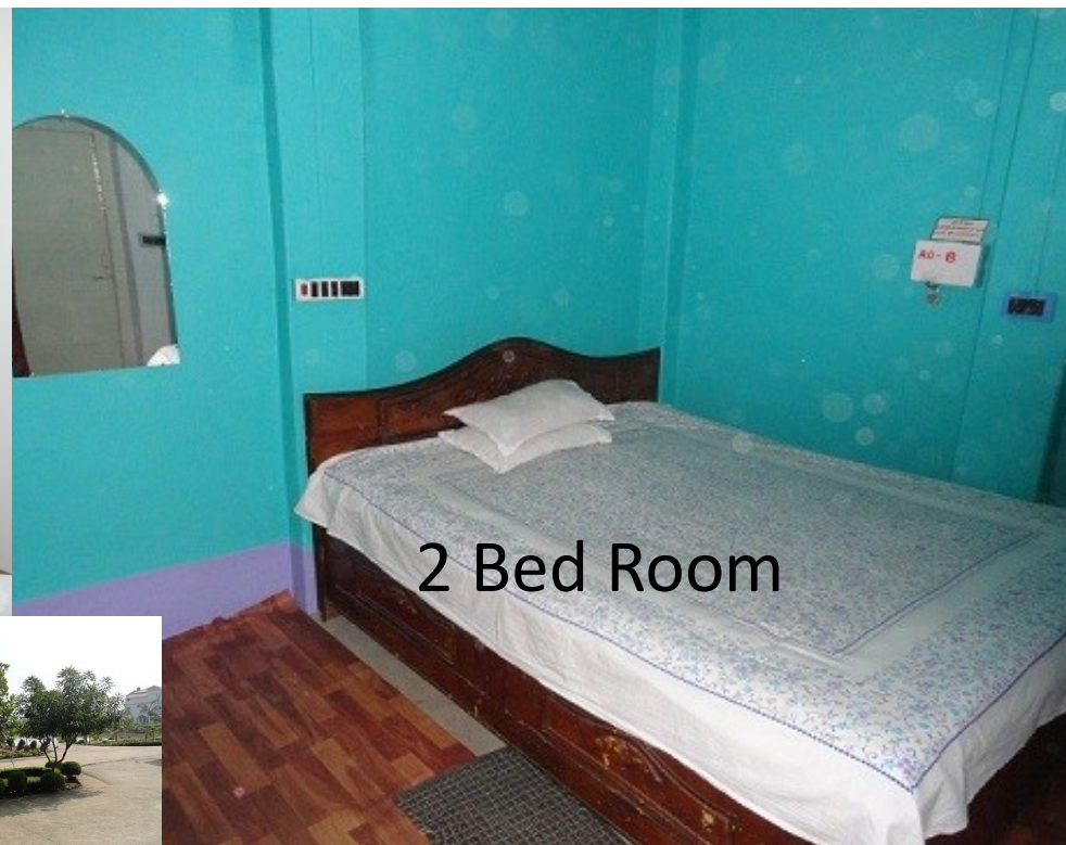
2 Bed Room