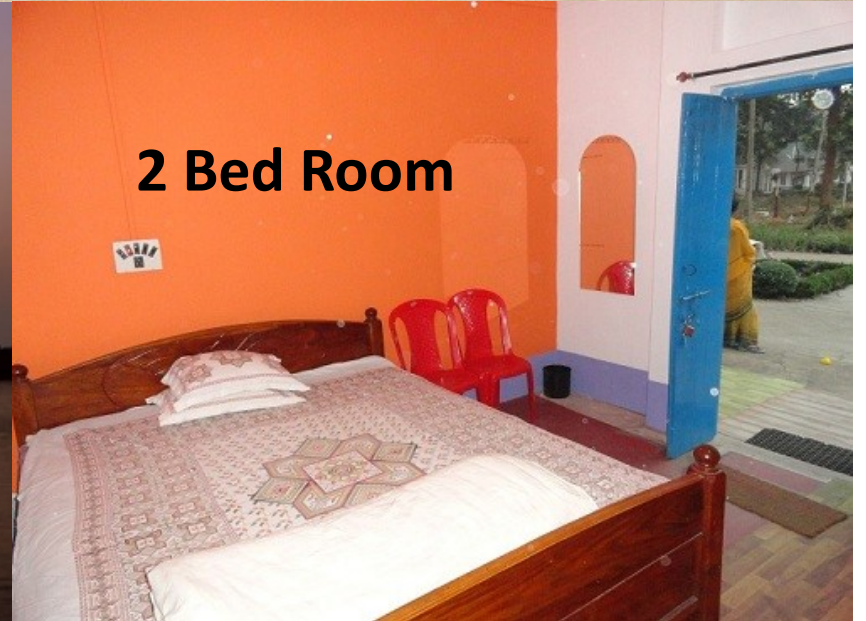
2 Bed Room