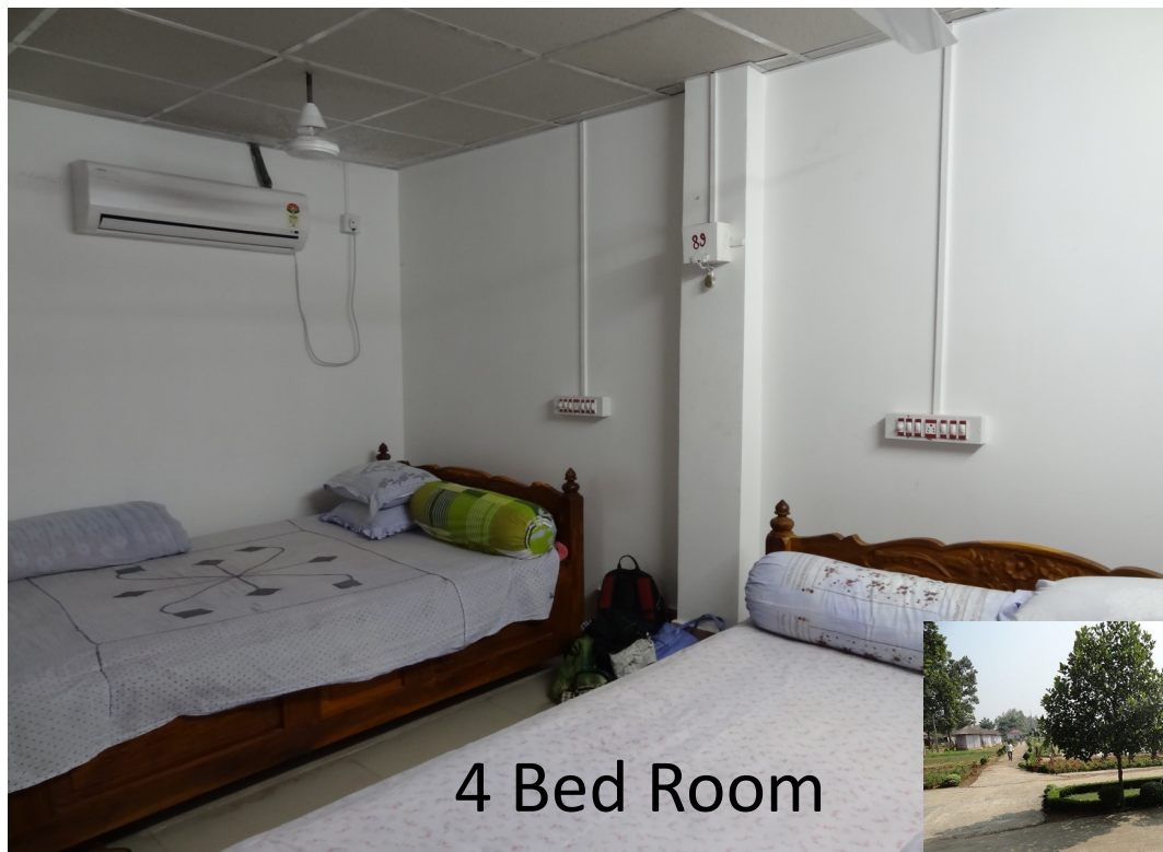
4 Bed Room